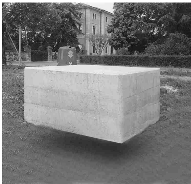
C.U.F.O. (Cube Unknown Fly Object)

E' una palese condizione di smarrimento e di ancestrale minaccia alla preziosa integrità dello sfintere anale, quella che si accompagna alla constatazione che in un modo o nell'altro il cubo ce lo porranno a spese nostre. Una sorta di silenziosa e mesta rassegnazione non scevra d'amaro sarcasmo.